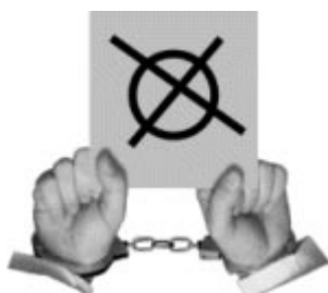
Libertäre Kampagne 98 (von der-markt-com): Wahlen ändern nur die Farbe der Fesseln...

Die Demokratie, wie jede andere Staatsform, läßt nicht zu, daß der Bürger sie als Außenstehender betrachtet. Sie läßt eine Entscheidung für oder gegen den Staat nicht zu. Per Definitionem werden Menschen zu Staatsbürgern, sodaß die Frage nach der Legitimierung des