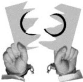
Libertäre Kampagne 98 (von der-markt.com): ... Nicht wählen sprengt die Fesseln!

Aus Sicht des Bürgers hat dies katastrophale Auswirkungen, denn in den