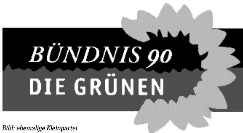
Bild: ehemalige Kleinpartei

Die Grünen verstanden sich zunächst als Bollwerk auch gegen das Berufspolitikertum. Dennoch, irgendwann mußte in den Parlamenten Platz nehmen, zunächst noch kritisch von der „Basis“ beäugt. Schnell gewannen die Parlamentarier zwangsläufig einen Informationsvorsprung gegenüber der „Basis“ und ein nicht nur finanzielles Eigeninteresse daran, die eigene Position entgegen dem zunächst beschlossenen Rotationsprinzip zu behaupten. Geradezu zwangsläufig entwickelte sich dabei ein gemeinsamer Corpsgeist mit anderen Parlamentariern, mit denen ebenso