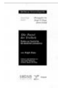
Raico, Ralph: Die Partei der Freiheit. Studien zur Geschichte des deutschen Liberalismus. Schriften zur Wirtschaftspolitik, Band 7, herausgegeben von Jürgen B. Donges und Johann Eekhoff, Verlag Lucius & Lucius, Stuttgart 1999, DM 68,-.

Raico unterzieht die dominierende Geschichtsschreibung über den deutschen Liberalismus einer fundamentalen Kritik. Er beklagt die Feindseligkeit deutscher Historiker gegenüber dem Liberalismus, den sie als bloße Ideologie der „Besitzenden“ deuten. In diesem Zusammenhang wird auch gerne und häufig das sozialistische Märchen einer