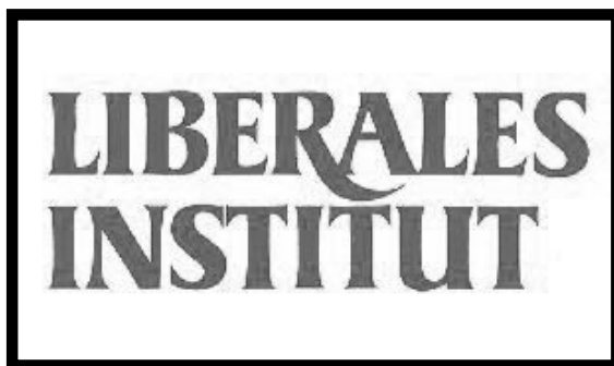
Bild: Logo des Liberalen Institutes, Zürich, dessen Leiter der Autor ist

turförderung betrieben wird, desto fragwürdiger wird sie. Öffentliche Kulturförderungen auf lokaler und regionaler Ebene sind darum weniger problematisch, weil es zu einem „Wettbewerb der Förderer“ kommt und die „Förderungslandschaft“ von einer Vielzahl politischer und geschmacklicher Schattierungen geprägt ist.