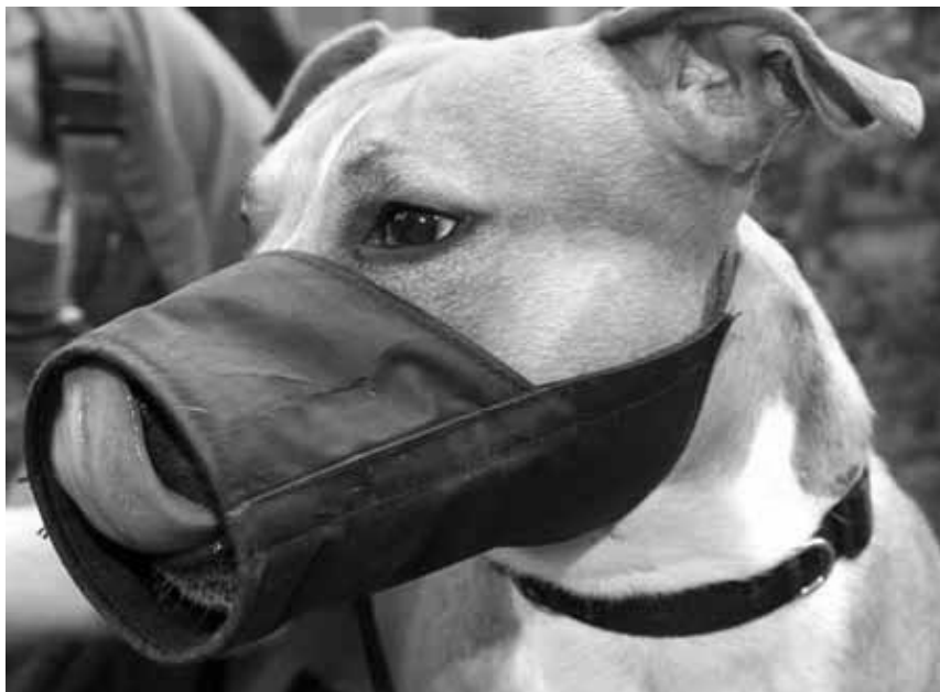
Bild: Die üblichen Kampfmittel des Staates - jetzt auch gegen Hunde...

Nun, die libertäre Marktgesellschaft wäre